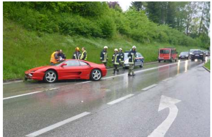
03. Mai: Verkehrsunfall auf der B 115