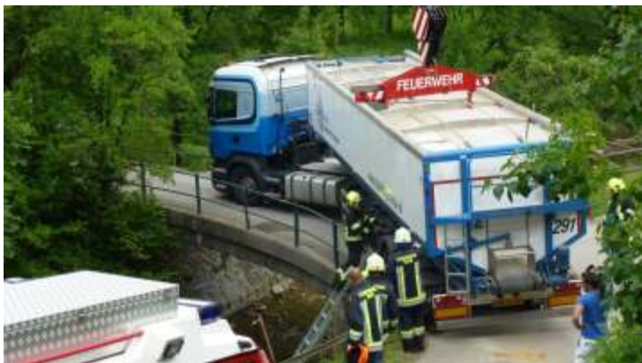
12. Juni: LKW Bergung, Kammergraberstraße