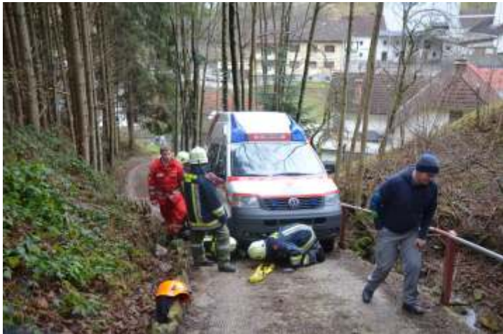
22. Jänner: Steckengebliebenes Rettungsfahrzeug

Bei 14 technischen Einsätzen leisteten 111 Feuerwehrleute 341 Einsatzstunden.