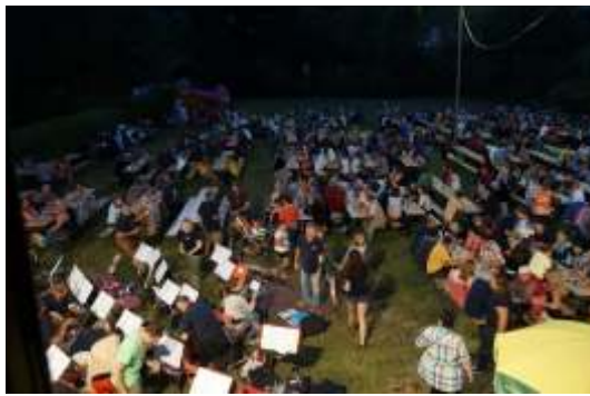
16. Juli: Grillabend

Beim erstmalig durchgeführten Gemeindebewerb nahmen wir mit der aktuellen Wettkampfgruppe Sand 1 und der "Oldie-Gruppe" Sand 2 teil. Die Gruppe Sand 1 konnte den Bewerb in Bronze und Silber für sich entscheiden, die Gruppe Sand 2 ein respektables Ergebnis erzielen.