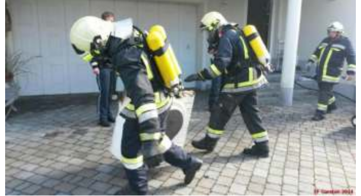
28. September: Brand eines Wäschetrockners in Garsten

Bei 3 Brandeinsätzen leisteten 61 Feuerwehrleute 48 Einsatzstunden.