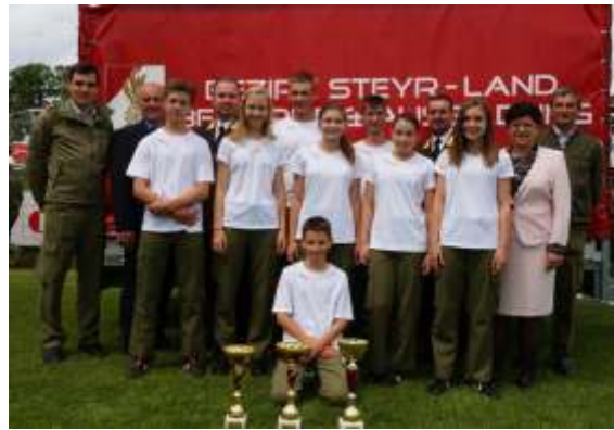
Die Jugendgruppe wird Bezirkssieger