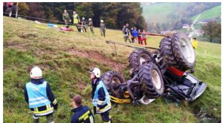
13. Oktober: Traktorbergung

Bei den technischen Einsätzen musste sich unsere Wehr einer großen Bandbreite von Szenarien stellen. Darunter fielen vor allem Verkehrsunfälle, aber auch Sturmschäden, Kanalreinigungen, Wasserversorgungen und Lotsendienste, die von uns bewältigt wurden.