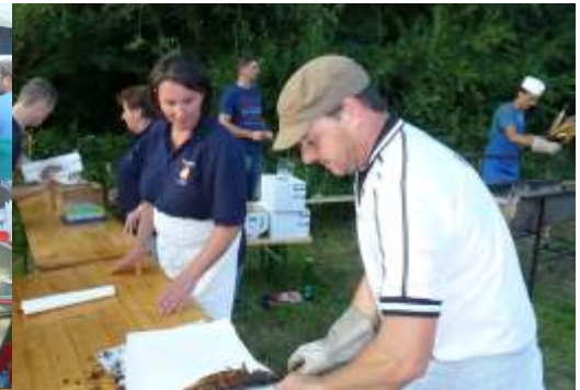
7. September: Schwarzbergfest